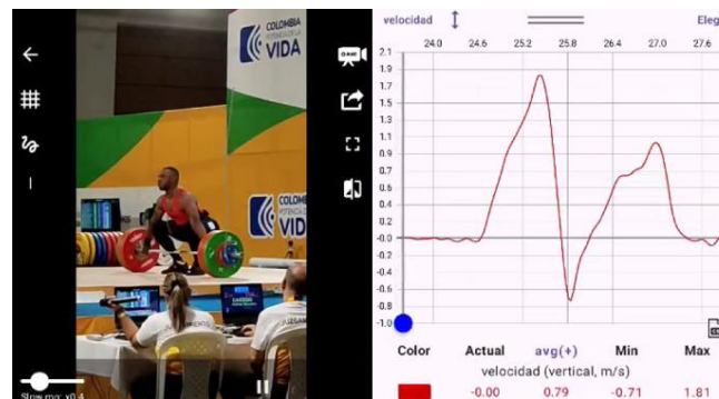
Figura 2. Comportamiento de la velocidad de la barra durante el arranque

Nota. Perfil de velocidad correspondiente al mejor intento válido en el arranque de un levantador colombiano de la categoría 81 kg, analizado mediante el software WL Analysis (versión 2.9.9.)